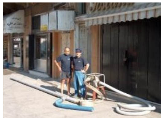
Tyr 2023 - Montage aspirateur SM. - C. Camilleri, C. Descamps – cl JS