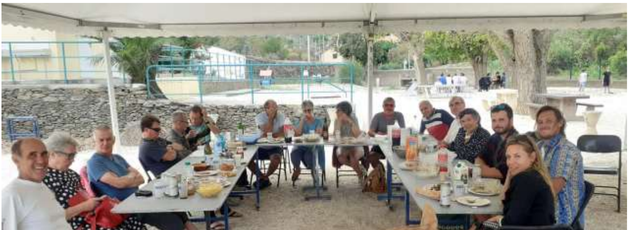
Le rapport d'activités est adopté à l'unanimité.

Un repas convivial a été organisé à Port-Vendres le 2 septembre 2023, type auberge espagnole.