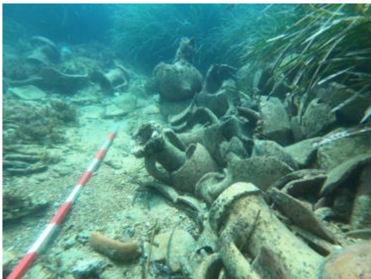
Tunisie 2023 - Baie de Tunis - Gisement de Dressel 1B

Un chantier école franco-tunisien sur les méthodes et techniques de recherches archéologiques subaquatiques s'est déroulé à Sidi Raïs du 24 juillet au 4 Aout 2023, avec la participation d'étudiant(e)s Tunisiens et