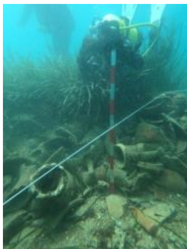
Tunisie 2023 - Baie de Tunis - Mesures - cl JS

La mission est soutenue financièrement, par l'institut Français de l'Ambassade de France en Tunisie, par le Centre de Recherches sur les Sociétés et Environnements en Méditerranée de l'Université de Perpignan Via Domitia (CRESEM - UPVD), par la Fédération Française d'Études et de Sports sous-marins (FFESSM) et la Commission Régionale d'Archéologie Occitanie FFESSM ; une participation financière a été aussi demandée aux étudiants français.